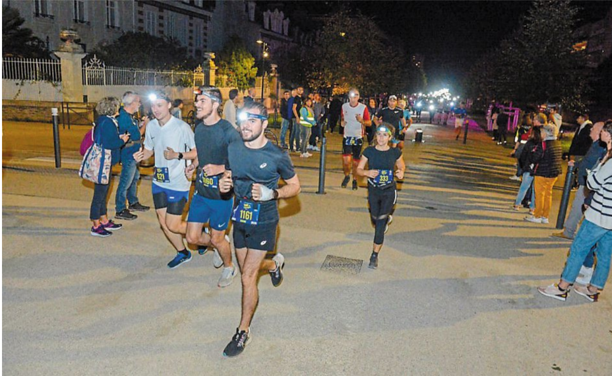
Angers, avenue Jeanne-d'Arc, 29 octobre 2022. Les coureurs devront obligatoirement porter une lampe frontale ou ventrale, en état de fonctionner, au départ de Trail de l'Apocalypse.

Les organisateurs avaient imaginé conclure cette 4 e édition pour la première fois sur la rive droite de la Maine, à hauteur de la cale de la Savatte, et non sur la promenade Jean-Turc, au pied du château. Pour des raisons de sécurité tenant au contexte international, la préfecture de Maine-et-Loire en a décidé autrement, sans gâcher pour autant le caractère inédit : les coureurs produiront en effet leur dernier effort sur 300 des 400 mètres de la piste d'athlétisme du Lac-de-Maine, dans une ambiance qui s'annonce festive. Autre nouveauté : le passage à l'intérieur de l'Hôtel de Ville et de la chapelle des Ursules. Le reste sera plus classique : place